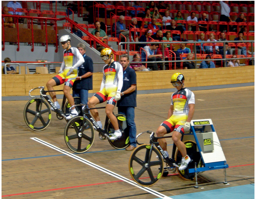
Fahrrad wird am Sattel und am Hinterrad gehalten, sowie beim Hinterrad abgestützt