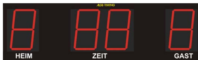
Beispiel einer Fußball Anzeigetafel D-LINE300-O-4-E2