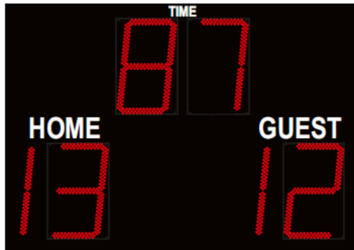
Beispiel einer Fußball Anzeigetafel D-FB450-2+2x1/2-O-WR