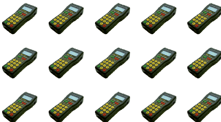
TIMY3 W für jeden Richter