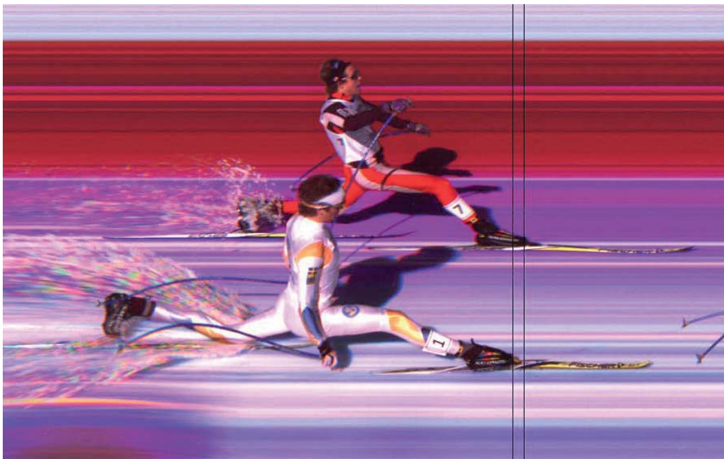
Entscheidung per Fotofinish - Zielbild vom ALGE-OPT1c2

Für manche Wettbewerbe genügt ein herkömmliches Zeitmesssystem. Für alle Disziplinen, bei denen viele Zielankünfte in kurzer Zeit erfolgen, ist ein Fotofinish dringend erforderlich. Mit dem Fotofinish System kann man das Zielbild mit der genauen Zeit für jeden Läufer bzw. jede Läufergruppe auf dem PC Monitor kontrollieren und Korrekturen vornehmen bzw. nicht erfasste Läufer feststellen.