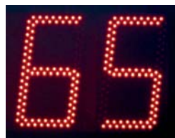
Digit mit 250 mm Ziffernhöhe